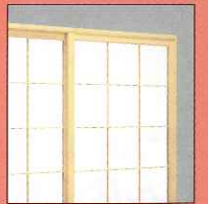
格子枠付アルミ格子