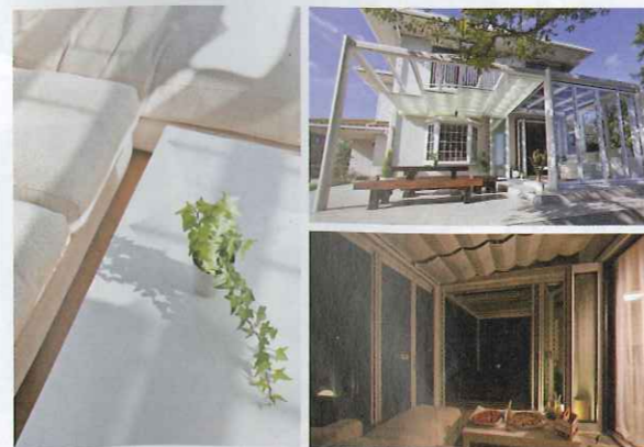
※写真の調度品などは屋外用を使用しています。

古いウッドデッキを取り払って「M.フレイジ」を設置。リビング〜ガーデンルーム〜パーゴラ〜庭。内から外へとゆるやかにつながり、すがすがしい開放感が味わえます。ソファで読書しながらまどろんだり、パーゴラの下でお茶したり。それぞれの空間で家族が思い思いの休日を過ごせる、そんな大人の庭です。